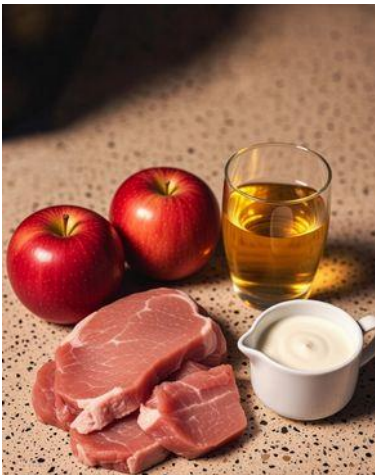
500–600 g de lomo de cerdo en filetes gruesos, 2 manzanas, 150 ml de sidra natural, 100 ml nata para cocinar