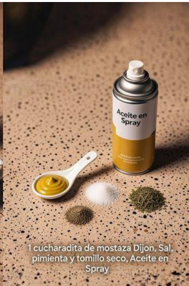
1 cucharadita de mostaza Dijon, Sal, pimienta y tomillo seco, Aceite en Spray