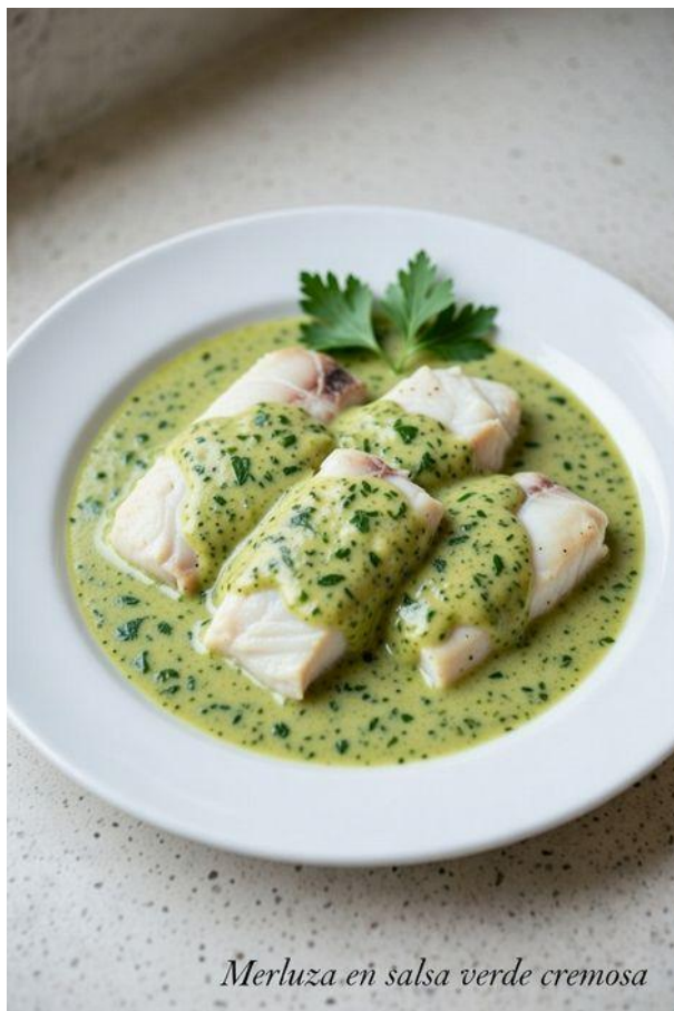
Merluza en salsa verde cremosa